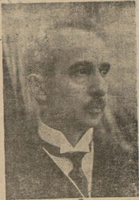
Başbakanımız General İsmet İnönü

Fırka Divanı Üyeleri İstanbulda bulunuyorlar. bu günlerde Divan Toplanacak.